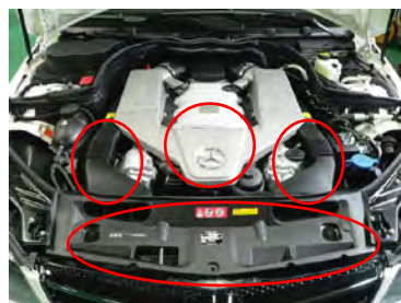
ノーマル写真 ラジエターパネル、導入ダクト、 センターカバーを外します。