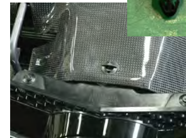
センター部はノーマルクリップで留めます。