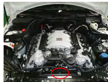
ボンネットオープナーワイヤーを 裏側にタイラップで留めます。