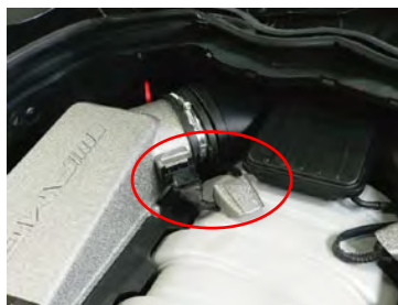
エアマスセンサーのカバーを外し、 バンドを緩めます。