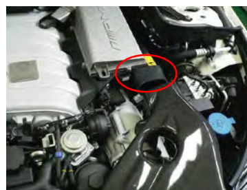
予めホースをノーマルケースに差し込み ておきます。 ※必ず脱脂して下さい。 三角形に変形させて入れるので窮屈です。 油分が付いているとホースが外れる場合があります。