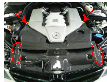
丸の部分とボンネットとのクリアランスが無いため、 ボンネット側にクッションテープを貼り付けます。 センターカバーの矢印部がラバーホースと干渉して 浮きますので削るなど加工して取り付けてください。