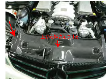
ラジエターパネルは上から押さえつけながら 左右共ノーマルビスで取り付けます。