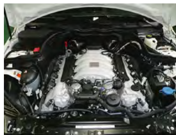
クリーナーケースを取り外します。 (上に引き上げる)