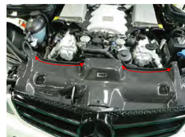
ラジエターパネルにダクトが乗っかる所の 上下にパッキンテープを貼り付けます。