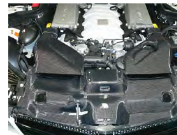
カーボン導入ダクトをホースに差し込み、 接続します。 ※必ず脱脂して下さい。