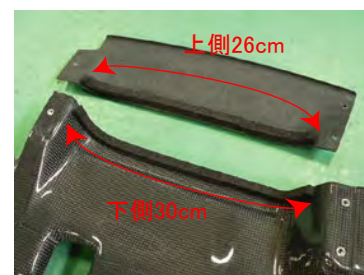
下側30cm、上側26cmにカットして 左右それぞれ貼り付けます。