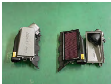
フィルターを付属のK&Nフィルターに 交換する。 P/N 33-2045