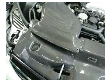
導入カバーを取り付けます。 (付属M4ビスAを使用) 定期的増し締め点検して下さい。